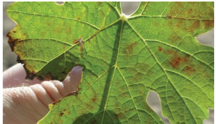
Figuur 2: Eerste tekens van rolblaarsiekte op h rooi druif kultivar.

Die eerste tekens van rolblaarbesmetting is rooi dele met onduidelike grense wat op die blaarweefsel tussen die are vorm (Fig. 2). Wingerdstokke wat onlangs besmet is, sal slegs hierdie simptome wys. Let verder op dat die intensiteit van die rooi kleur neig om tussen die rooi kolle te verskil (hulle is nie eenvormig in kleur nie) (Fig. 3).