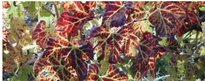
Figuur 7: Wingerd-rolblaarsimptome op Pinotage.

By ander kultivars (Cabernet Sauvignon, Shiraz, Pinotage) ontwikkel die rooi verkleuring, maar die blaarrande krul nie na onder nie (Fig. 7).