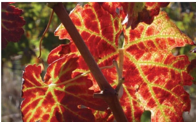
Figuur 5: Rolblaar met mid-rib en hoofare wat later in die seisoen geel word.

Die beste tyd om vir simptome te monitor, is laat in die seisoen voor die blare begin afval, alhoewel rolblaarbesmette wingerdstokke hulle blare eers 'n bietjie later as onbesmette stokke verloor (Fig. 8).