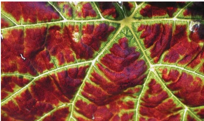
Figuur 4: Rolblaar waar die hoof blaar-are groen bly.

By ander kultivars (Cabernet Sauvignon, Shiraz, Pinotage) ontwikkel die rooi verkleuring, maar die blaarrande krul nie na onder nie (Fig. 7).