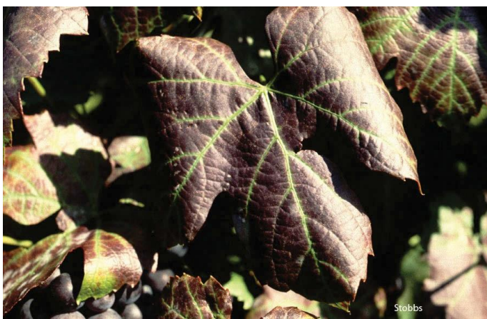
Figuur 6: Rolblaarsimptome op Cabernet franc. Let op die blaarrande wat duidelik na onder krul.

In sommige kultivars (Pinot noir, Cabernet franc en tot 'n mate Merlot) begin die blaarrande na onder krul (vanwaar die naam "rolblaar"). Dit mag al hoe meer sigbaar raak (Fig. 6).