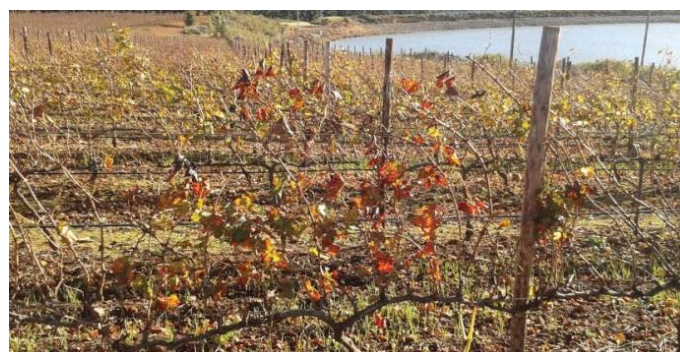
Figuur 8: Rolblaarbesmette wingerdstokke wat se blare eeffe later val.

Die beste tyd om vir simptome te monitor, is laat in die seisoen voor die blare begin afval, alhoewel rolblaarbesmette wingerdstokke hulle blare eers 'n bietjie later as onbesmette stokke verloor (Fig. 8).