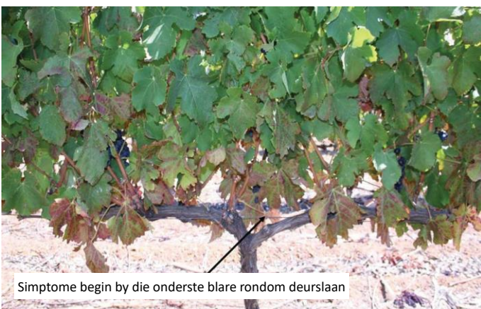
Simptome begin by die onderste blare rondom deurslaan

Simptome is geneig om op die oudste blare aan die onderkant van die loot te begin en gedurende die seisoen opwaarts te beweeg (Fig. 1).