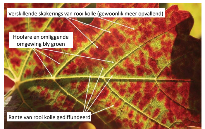
Figuur 3: Naby skoot van rolblaarsimptome wat die rooi kolle tussen die groen hoofare wys.

Die rooi kolle op die blaar raak geleidelik groter totdat die hele laminêre blaaroppervlak gevul is, wat h groen area om die grense van die hoofare vorm (Fig. 4). Die blaar-are neig om groen te bly en baie laat in die seisoen geel te word (Fig. 5).