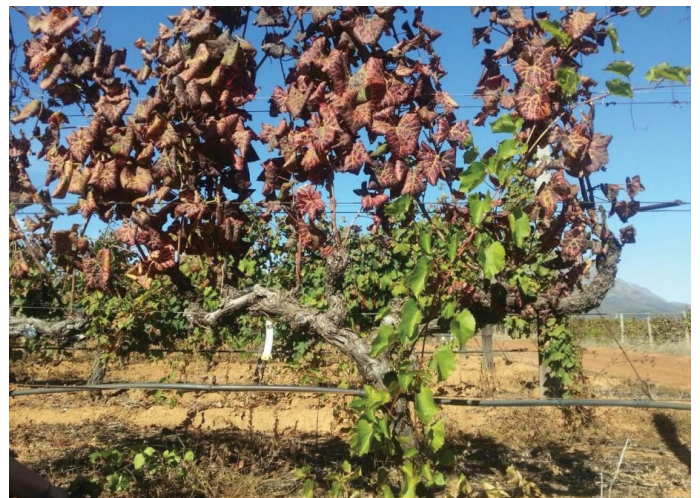
Figuur 1: Geen simptome word deur die R99 onderstok uitgedruk nie, selfs al word daar ernstige simptome van rolblaarbesmetting deur die bostok uitgedruk.

V. vinifera kultivar gedoen moet word. Klonale eienskappe van die finale ontwikkelde kultivar sal ook gerevalueer moet word.