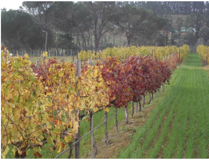
Figuur 1: Stroke van twee of drie aanliggende rolblaarbesmette wingerdstokke, wat dui op infeksie vanaf 'n enkele besmette wingerdstok langsaan plante in dieselfde ry.